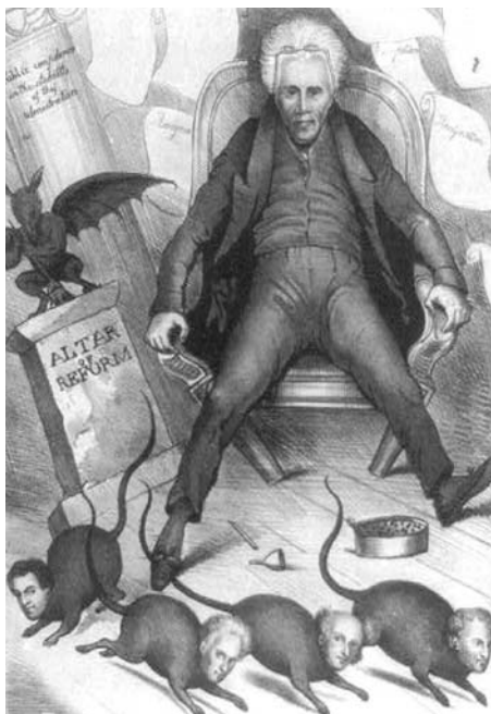
Крысы покидают рушащийся дом

На ней изображен сидящий на разваливающемся стуле Джексон, рядом с ним «алтарь реформ» с расположившимся на нем «дьяволом». Во все стороны убегают из рушащегося Белого дома крысы с головами бывших министров (слева направо: военный министр Джон Х. Итон, министр военно-морского флота Джон Брэнч, государственный секретарь Мартин Ван Бюрен, которого Джексон пытается удержать, наступив ногой на хвост, и министр финансов Сэмюэль Д. Ингэм). Не помогает даже миска с кормом — намек на щедрое финансирование федеральных чиновников. Позади президента на стене приколоты листы со словом «отставка». Также на заднем плане изображена пошатнувшаяся колонна с надписью: «Доверие населения к стабильности этой администрации».