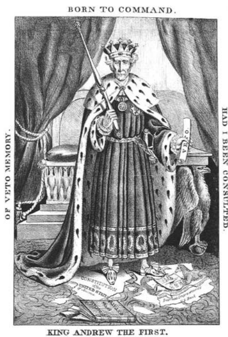
KING ANDREW THE FIRST.