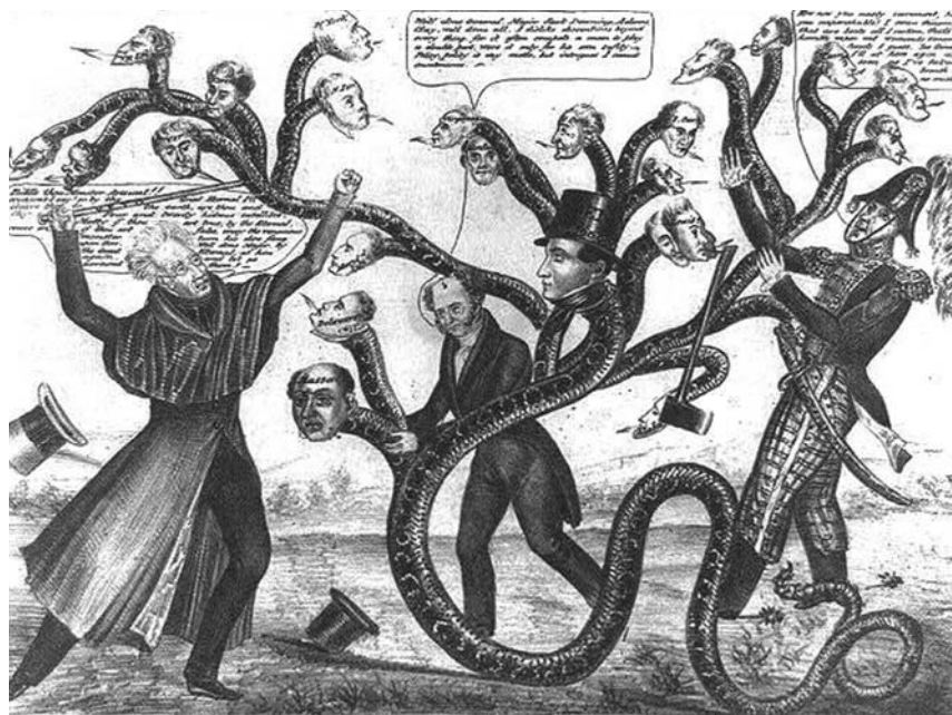
Джексона, сражающийся с многоголовым чудовищем

Весьма красочны и хлестки реплики врагов Джексона. Клей: «Это именно то, что в Кентукки называют большой игрой для маленького Джека». Уэбстер: «А в Массачусетсе это называют жаркое». Престон: «А в Южной Каролине это называют барбекю. Только он должен немного подрумяниться». Биддл: «В Пенсильвании нам затруднительно найти место для этого животного, но мы решили называть его неописуемым отродьем кабана, генерала, человека и дьявола». Неизвестный: «Мы думаем, что он сильно напоминает кладоискателя, потому что он раскопал наши сокровища по всей стране. И он хотел создать спецфонд для своих сторонников, но Клей ухватил его, вдел ему кольцо в нос, и вот он здесь».